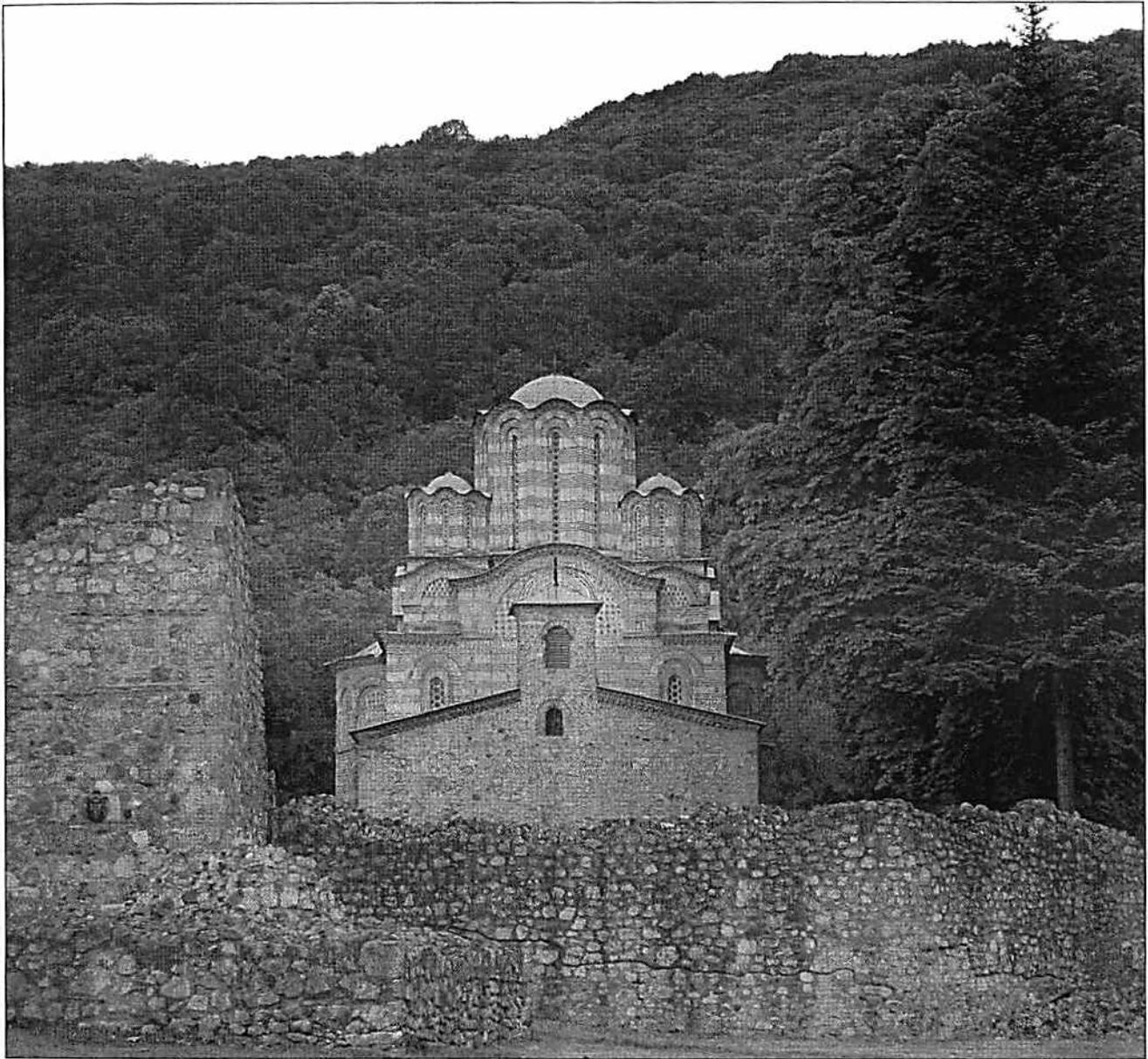
Сл. 1. Манастир Раваница

ма у унутрашњости Балкана, може се наслутити по каснијим изворима. 20 Посебна историја продирања Срба у велике градове може се пратити по грађевинској делатности Немањића. Од почетка XIV века Милутин све више зида по Истоку: у Солуну, Цариграду, чак и у Јерусалиму — највише цркве и болнице. Цариград се увек свечано помиње — он је „Богосаздани град“ (Θεόκτιστος πόλις); у тексту О српских господох наводи се да Милутин „сзиди же и въ богосзданиѣмъ константине граде“ цркве и болнице. 21 Термин богосаздани град није само преписан — постоје српски текстови о зидању Цариграда. 22 Та радозналост у односу на историју старе царске престонице није била случајна. Од осамдесетих година XIII века српска држава добија нове градове и Срби почињу све више да се упознају са урбаним животом. Истовремено су текла два процеса. Српско сеоско становништво сели се у градове, док се у измењеном граду појављују нове занатлије, нова управа и ново законодавство. У духовном животу те појаве добијају — у српској средини — нова објашњења. Прастаре идеје о савршеном граду, које су из Византије пренесене у XI и XII веку у Русију, почињу обновљени живот у држави Немањића од средине XIV века. Историја практичног градског живота у средњовековној