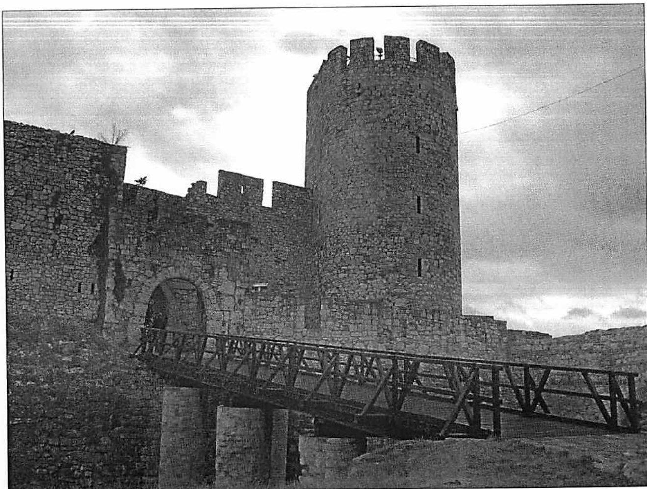
Сл. 3. Београдска тврђава, Истична капија Горњег града

XIV века. Ту се појављују два главна (нова) елемента. Визија се ослања на описе небеске хијерархије Псевдо-Дионисија Аеропашког; то се нарочито односи на описе и поделу анђeosких чиновa. У исти мах рај се одређено показује као земаљски двор. Небески становници одевени су као дворани. Изводи се велико упоређење — la cour céleste личи на цариградски двор и на његове млађе имитације. Одавно се зна да је то доста смело упоређење земаљског двора с небеским прво изведено у побожној књижевности, на пример у познатом Живоју светиог Василија Новог . Игра са упоређењима испредала се све сложеније. Некада једва наговештене, поједностављене слике раја — небеске војске, становника и станова — постају све исцрпније. Последњих деценија XIV века кнез Лазар, као и његови наследници касније, инсистира на томе да је организација двора слична рајској хијерархији, да дворани и својим изгледом подсећају на рајске становнике и да грађевине које подиже двор личе на небеске станове „Новог Јерусалима“.